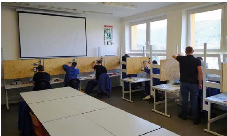
Nová elektrotechnická dílna